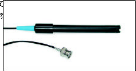
ET1115ガルバニック酸素電極

水溶液中の酸素濃度の標準的測定。本電極は白金陰極と鉛陽極で構成されていて内部の7.5 k \Omega 抵抗を介して接続されています。空気飽和脱イオン水の出力は通常25 °C で20 ~ 35 mV です。電極はe-corder装置のBNC入力に直接接続できます。